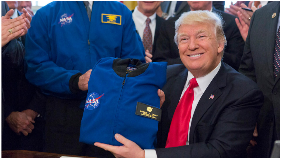
El Presidente Trump recibe una chaqueta de vuelo de la NASA en la Casa Blanca; marzo de 2017.

En el sudoeste de Asia hay acontecimientos positivos que le dan esperanza al futuro, a pesar de