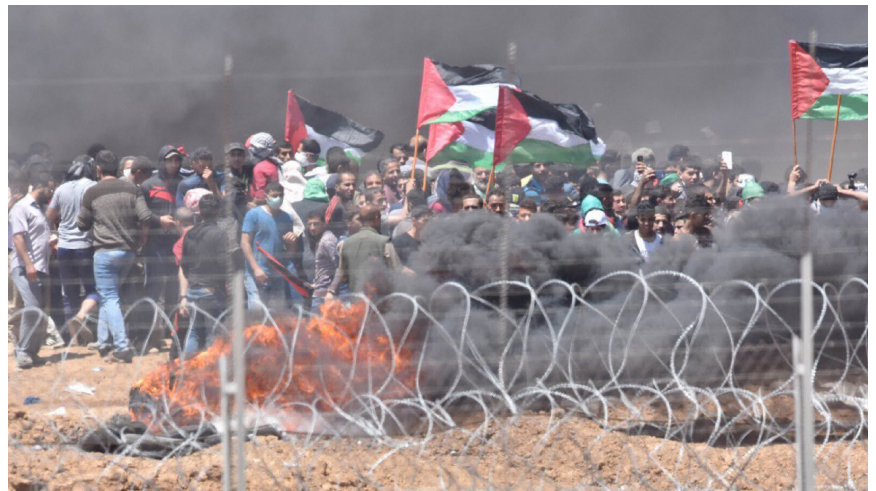
14 de mayo de 2018 en la frontera de Gaza. (vocero de las Fuerzas de Defensa Israelíes / Twitter).

Zepp-LaRouche dijo en conversaciones con sus asociados: “Nada más quiero decir que esta situación en el Medio Oriente es realmente peligrosa. Creo que debemos exigir también de manera absoluta, que se lleve a cabo una investigación sobre lo sucedido... Primero que todo, ubicar la embajada de Estados