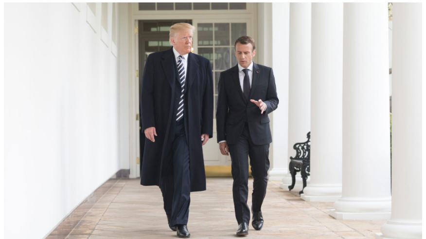
El Presidente Trump de Estados Unidos y el Presidente Macron de Francia; 4 de abril de 2018.

Perdón, Monsieur, pero el intento de golpe de Estado de los británicos contra el Presidente, todavía no ha ganado, y en realidad, se encuentra muy estropeado, ya que el agente del MI6, Christopher Steele, y sus cómplices estadounidenses de la comunidad de inteligencia de Obama y del Departamento de Estado de Obama, se acercan cada vez más a enfrentar una investigación penal. El representante de California, Devin Nunes, que encabeza la investigación de la Comisión de Inteligencia de la Cámara de Representantes sobre las acusaciones detrás de la farsa del Rusiagate, ha determinado que “no hubo inteligencia oficial que se utilizó para iniciar esta investigación”. Más bien, fueron todas mentiras británicas, difundidas a los medios noticiosos como “noticias falsas”, como lo ha afirmado correctamente Trump en repetidas ocasiones.