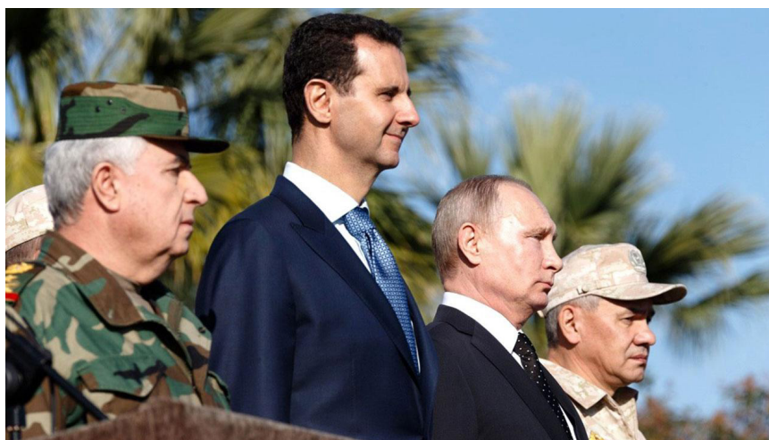
El Presidente Assad de Siria y el Presidente Putin de Rusia, en Siria, diciembre de 2017.

Pero el laboratorio Spiez, del Departamento Federal Suizo para la Defensa y Protección, que es