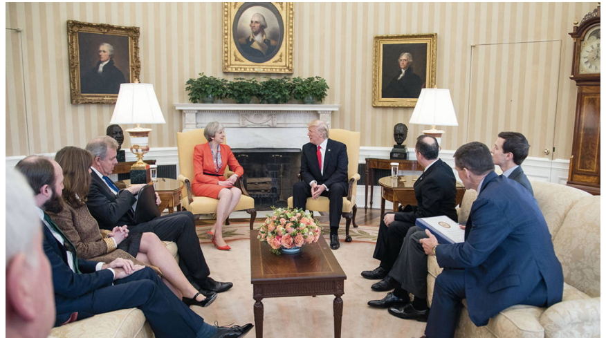
El Presidente Donald Trump conversa con la primera ministra británica Theresa May durante la reunión bilateral en la Sala Oval, viernes 27 de enero de 2017. La primera ministra May fue la primera jefa de gobierno que visitó oficialmente la Casa Blanca de Trump.

Helga LaRouche señaló antier que Londres ha hecho esto en reacción al descrédito del conato de golpe dirigido por los británicos del “Rusiagate” en contra del Presidente Donald Trump. Todo el cuento del “gas nervioso ruso” no es más que la continuación del Rusiagate, reinventado y revivido. Su éxito, hasta el momento, luego del fracaso del Rusiagate contra