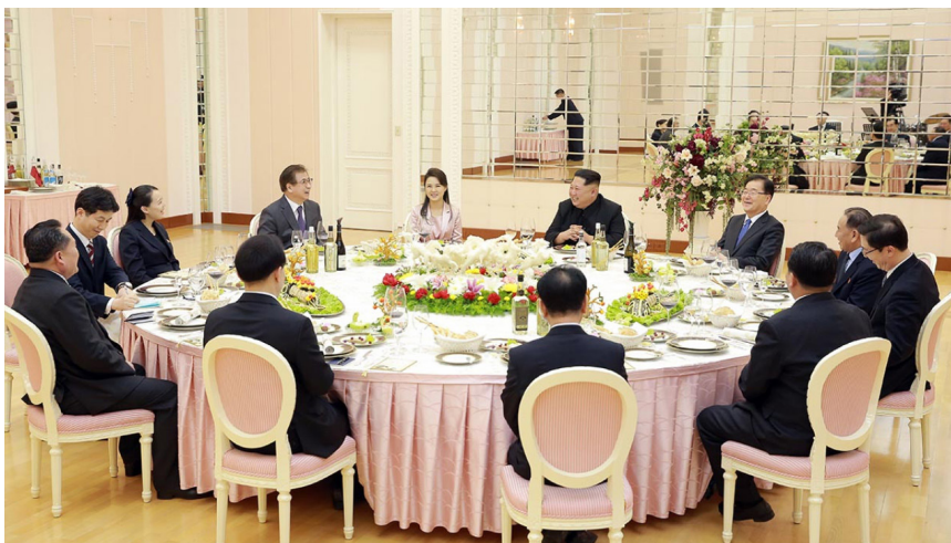
Corea del Norte y Corea del Sur coincidieron en realizar una tercera cumbre en abril. En la foto, Corea del Sur envió una delegación al Norte para organizar una reunión con el dirigente norcoreano Kim Jong-un.

En un sentido, tanto Rusia como China han introducido “nuevos principios políticos” —es decir, flancos inesperados— a la situación estratégica mundial, lo cual no solo agarró desprevenidos al imperio británico y a sus aliados de Wall Street y Washington, sino que los ha dejado atarantados