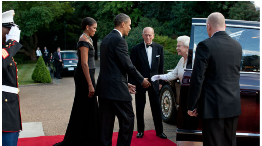
Barack Obama recibe a la reina Elizabeth II y al príncipe Felipe, duque de Edimburgo, antes de una cena en honor de la reina en Winfield House, en Londres, Inglaterra, el 25 de mayo de 2011.

Esto, y no un supuesto debate perfilado sobre las leyes sobre armas, es el problema que plantea la reciente masacre de estudiantes en Florida y las decenas y decenas de incidentes similares que han sucedido por todo el país en los últimos años. Como subrayó el gobernador de Kentucky Matt Bevin en una entrevista videograbada reciente que está circulando ampliamente en Internet, el problema es que toda la