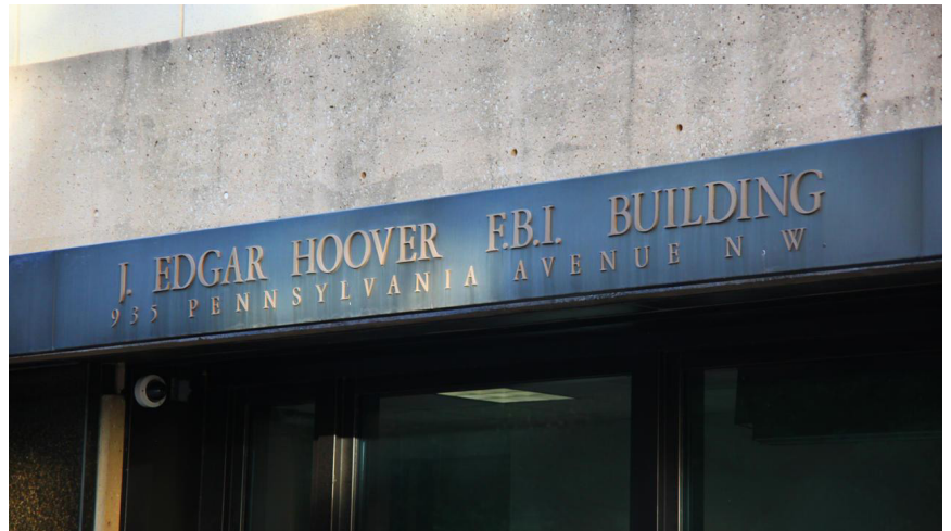
Antigua entrada para transeúntes al edificio del FBI en Washington, DC.

El gobernador republicano de Florida, Rick Scott, también calificó la respuesta del FBI al segundo aviso como “inaceptable”, y pidió la renuncia del director del FBI Wray. “Nosotros siempre fomentamos la consigna de ‘ves algo, dí algo’, y una persona valiente hizo eso precisamente al FBI. Y el FBI no hizo nada. ‘Ves algo, dí algo’ es una herramienta increíblemente importante, y la gente debe tener confianza en que la