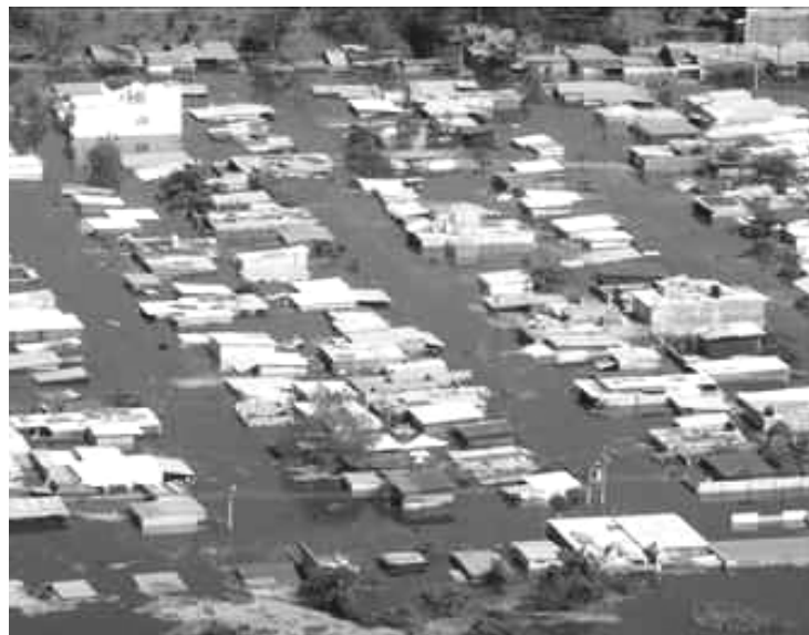
Tabasco México (Desbordamiento del río Grijalva)

Estamos viviendo la crisis económica-financiera y cultural más grande de la historia de la humanidad. La realidad se asoma con el desastre en Tabasco, Chiapas y Oaxaca; desabasto de alimentos, falta de agua potable y medicinas, latentes brotes de epidemias, ciudades enteras bajo el agua. Se puede comparar fácilmente los resultados de la política del "neoliberalismo" o del "Libre comercio" en México con la escena de Tabasco hoy, tal como lo vimos en E.U. con el huracán "Katrina". Los gobiernos de ambas naciones resultaron incompetentes para abordar los fenómenos meteorológicos al carecer de infraestructura y de programas pertinentes. El 31 de agosto de 2005, el economista demócrata Lyndon H. LaRouche, enumeró las medidas que debían tomarse de inmediato para abordar lo que no pudo el gobierno de Bush Jr., advirtiendo que la perspectiva principal era el desarrollo de los sectores productivos y de infraestructura. La necia política de guerra del vicepresidente Dick Cheney y Bush, desatendieron todos estos sectores importantes de la economía en EU. Los cuatro estados en los que golpeó el huracán "Katrina" habían sido devastados antes económicamente al igual que toda la república mexicana lo fue en los últimos 25 años. No sólo se pararon los proyectos de infraestructura sino se desmantelaron los existentes, principalmente en gestión de aguas, transportes y energía.