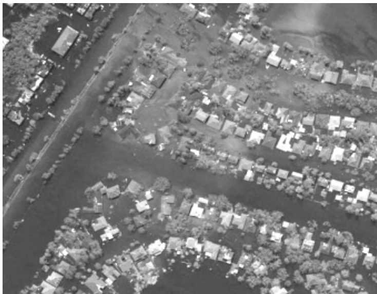
Nueva Orleans EUA (durante el huracán Katrina)

Estamos viviendo la crisis económica-financiera y cultural más grande de la historia de la humanidad. La realidad se asoma con el desastre en Tabasco, Chiapas y Oaxaca; desabasto de alimentos, falta de agua potable y medicinas, latentes brotes de epidemias, ciudades enteras bajo el agua. Se puede comparar fácilmente los resultados de la política del "neoliberalismo" o del "Libre comercio" en México con la escena de Tabasco hoy, tal como lo vimos en E.U. con el huracán "Katrina". Los gobiernos de ambas naciones resultaron incompetentes para abordar los fenómenos meteorológicos al carecer de infraestructura y de programas pertinentes. El 31 de agosto de 2005, el economista demócrata Lyndon H. LaRouche, enumeró las medidas que debían tomarse de inmediato para abordar lo que no pudo el gobierno de Bush Jr., advirtiendo que la perspectiva principal era el desarrollo de los sectores productivos y de infraestructura. La necia política de guerra del vicepresidente Dick Cheney y Bush, desatendieron todos estos sectores importantes de la economía en EU. Los cuatro estados en los que golpeó el huracán "Katrina" habían sido devastados antes económicamente al igual que toda la república mexicana lo fue en los últimos 25 años. No sólo se pararon los proyectos de infraestructura sino se desmantelaron los existentes, principalmente en gestión de aguas, transportes y energía.